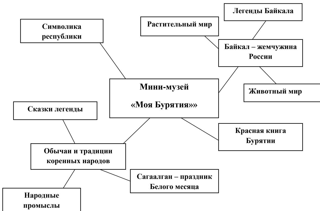
Схема совместной работы