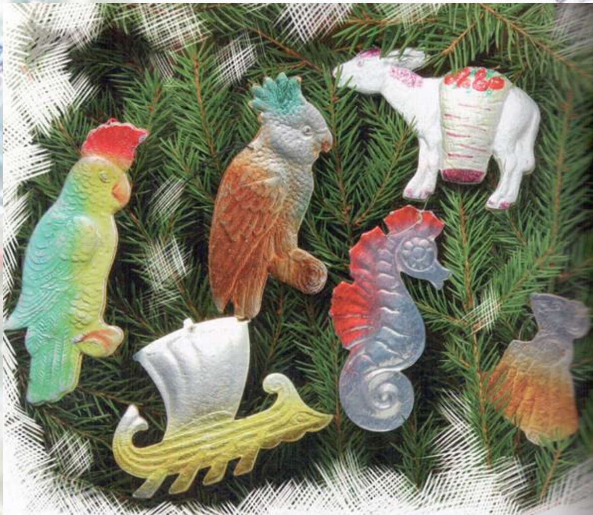
Ёлочные игрушки из прессованного картона.