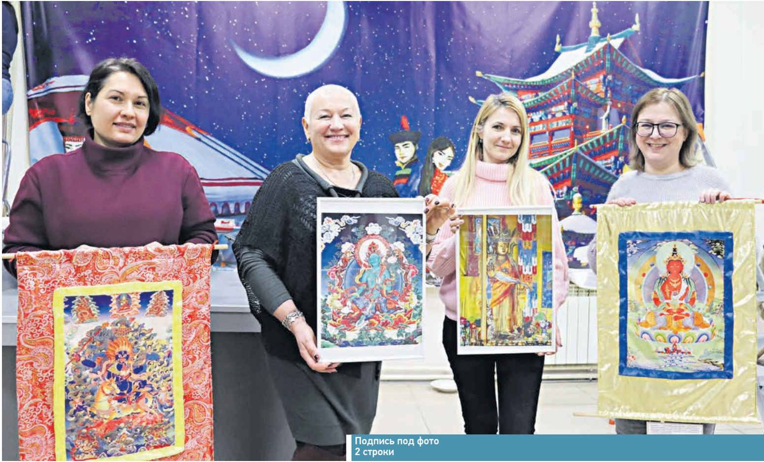
Подпись под фото 2 строки