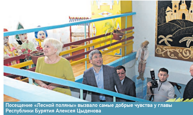
Посещение «Лесной поляны» вызвало самые добрые чувства у главы Республики Бурятия Алексея Цыденова